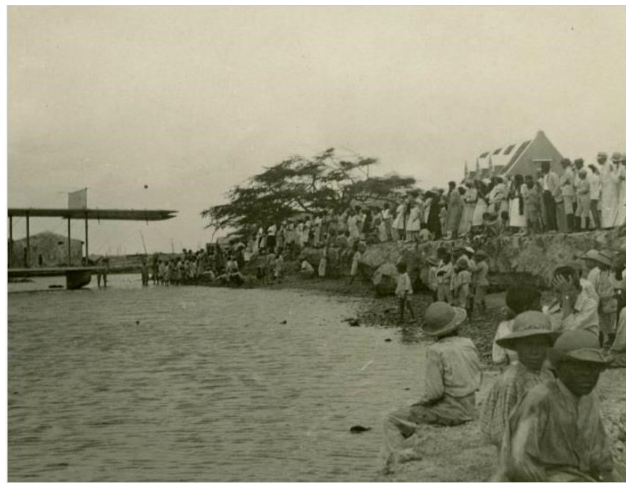
Aki ta na e binnenwater na Schottegat na Corsou

Dia 15 di augustus 2014, mi a post dos potret den Facebook, cu mi ta encera, sin tabatin e minimo idea cu si e potretnan aki a wordo tuma na Aruba of na Corsou. Debi na varios discussion actualmente unda nan a wordo saca, mi a dicidi di haci un investigacion mas extenso.